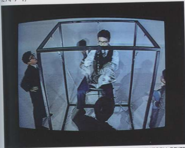
RECOMMENDATORY PRIZE Makoto TERAMOTO video art