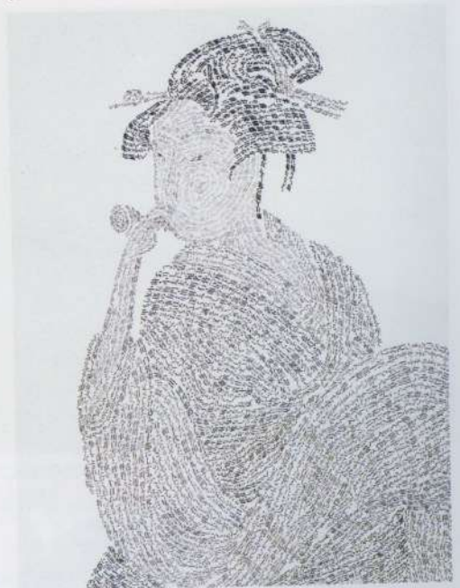
RECOMMENDATORY PRIZE Masayuki NAGAHISA illustration